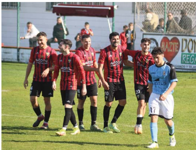
Los jugadores de la UD Roteña celebran uno de los goles marcados ante la RB Linense B. MOISÉS VILLALBA

descompuesta en pedazos ante una Roteña que completó una brillante actuación.