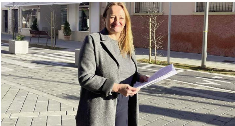
Imagen de la delegada de Desarrollo Económico en la avenida María Auxiliadora

La convocatoria tiene un montante total de más de 61.000 euros de fondo de crédito que al igual que ocurrió en la primera convocatoria, las ayudas tienen un mínimo de 900 euros hasta 1.400 máximo. La delegada avisa que aquellos negocios aprovechados de estos beneficios en la anterior convocatoria no podrán acogerse a esta nueva oportunidad que está pensada para aquellos que no pu-