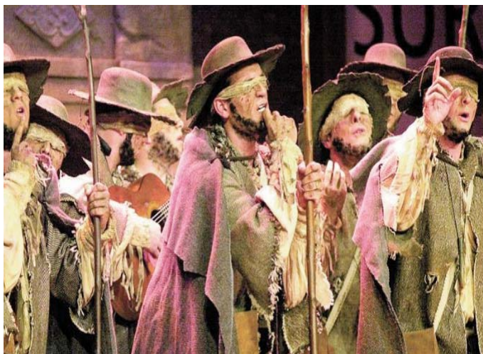
Imagen de la Comparsa 'La niña de mis ojos'