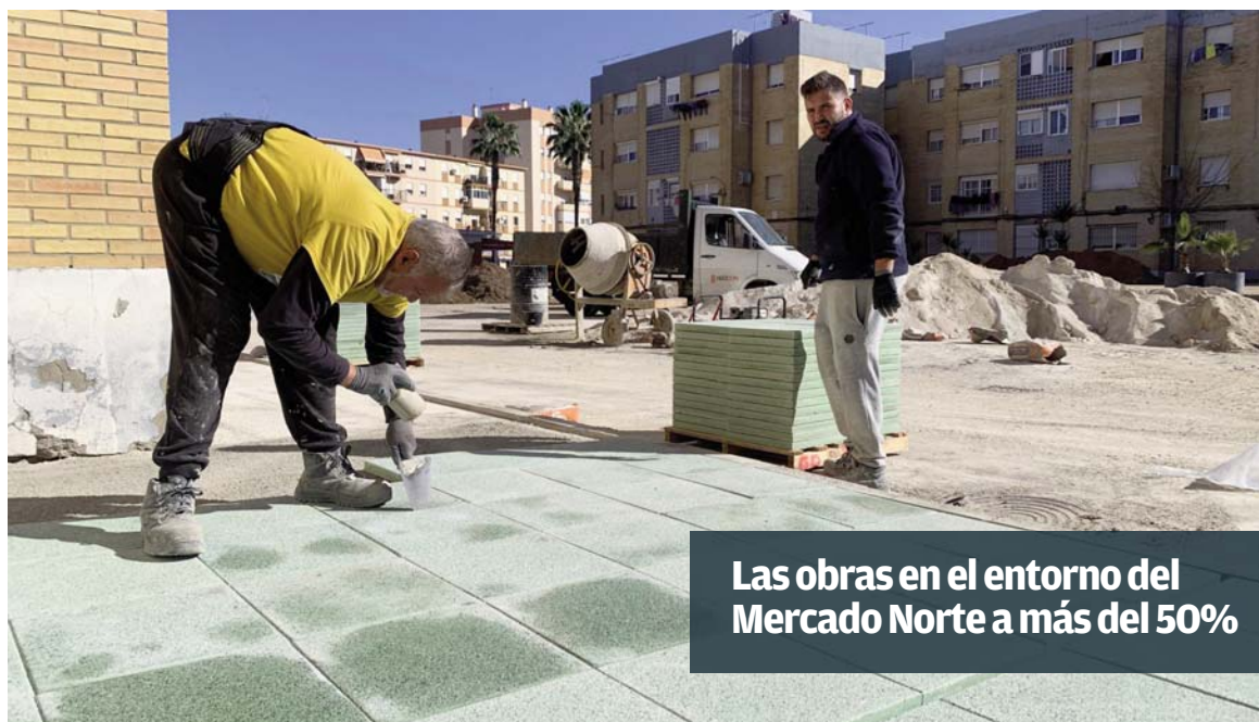
Las obras en el entorno del Mercado Norte a más del 50%

RESPONSABILIDADES MUNICIPALES El primer edil asegura que “la recaudación de impuestos y tasas es materia municipal” y explica que “la Diputación nos ayuda a la recaudación” VENTAJAS DEL ACUERDO Beneficios para el ciudadano y para el Ayuntamiento