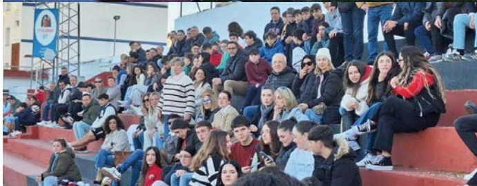
Derbi de juveniles entre la UD Roteña y el CD Rota en el Manuel Bernal-Sánchez Romero.